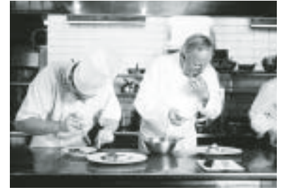
Norska råvaror förädlas under stjärnkocken Eyvind Hellstrøms överinseende.

På Bio Sture i Stockholm visas, förutom tio nya långfilmer i olika genrer, kortfilmer och ett retrospektiv med norska klassiker. Filmveckan startar 1 april. För mer info: www.norge.se