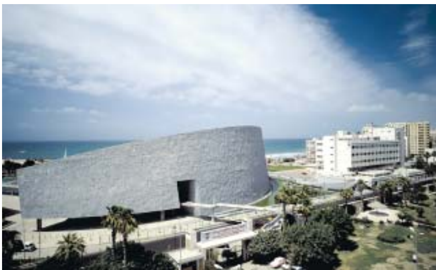
Biblioteket i Alexandria har blivit en arkitektonisk succé. Dessutom fungerar det bra, kanske beroende på den enkla geometriska formen, i princip ett tefat som kraschlandat och blivit stående delvis nedsjunket i ökensanden.