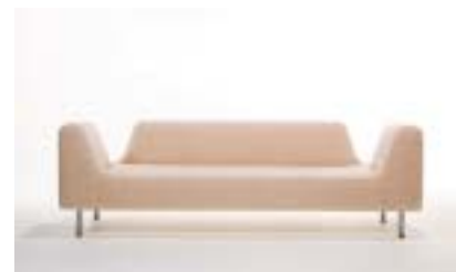
Soffserien UGO, av den norska designgruppen Norway Says, har hamnat i designens finrum.

Mer om Norway Says och deras senaste produkter finns på gruppens hemsida: www.norwaysays.com